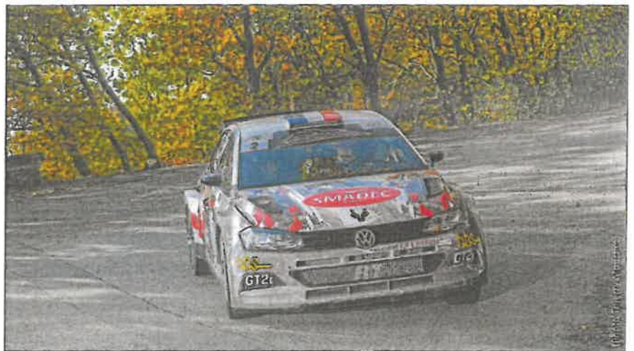
Son habituelle Skoda Fabia n'étant pas disponible, Bruno Riberi retrouve cette Volkswagen Polo.

Un organisateur heureux puisque pas moins de 142 concurrents vont chasser le chrono à partir de 13 h. - On a dû remodeler la seconde étape parce qu'à L'Escarène, le parking multimodal de la Gare n'était pas disponible. La zone d'assistance reste donc implantée sur la commune de Sospel durant deux jours. Et la boucle du dimanche change de sens avec quelques modifications,