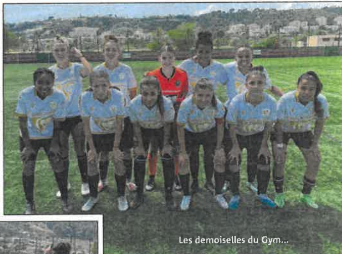
Les demoiselles du Gym...