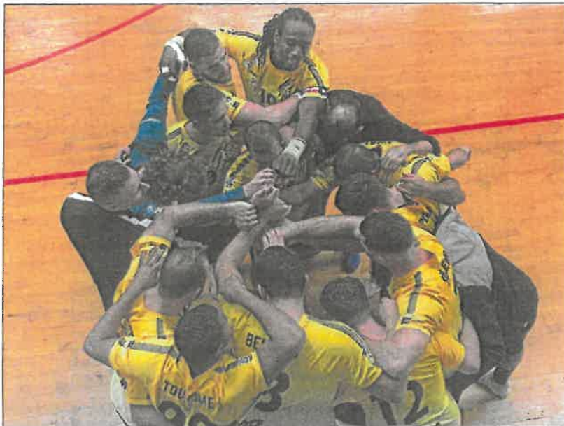
Les Niçois espèrent pouvoir enchaîner, dès samedi en Avignon...