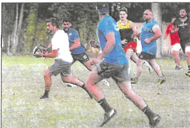
Les Grassois entament leur saison demain à La Valette.