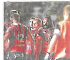
Les Toulonnais sont attendus à Perpignan, en ouverture de la 4 e journée

Journée suivante (15). - Samedi 01 octobre : Bordeaux-B. - Stade Français (15h), Brive - Bayonne (17h), Clermont - Lyon (17h), Pau - Toulon (17h), Perpignan - Castres (17h), La Rochelle - Racing 92 (21h05). Dimanche 02 octobre : Montpellier - Toulouse (21h05).