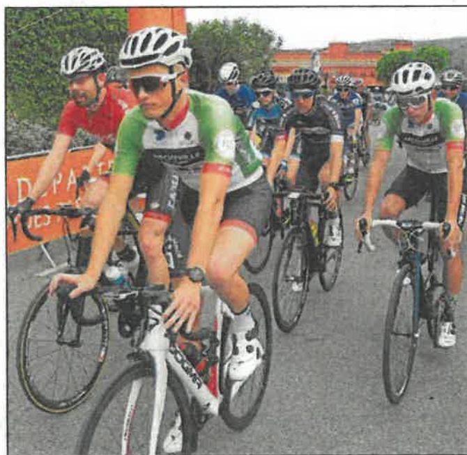
Les organisateurs attendent entre 150 et 200 coureurs pour cette deuxième édition.