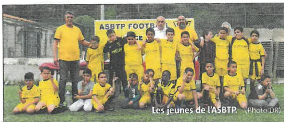
Les jeunes de l'ASBTP.

Palmarès. — U6 : AS Monaco. U7 : La Trinité. U8/U9 : Gazelec Nice. U10 : Collobrières. U11 : FCN Victorine.