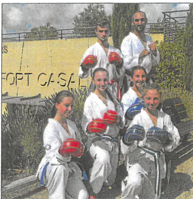
Cap sur la coupe du monde en Slovénie pour les combattants de la commune.