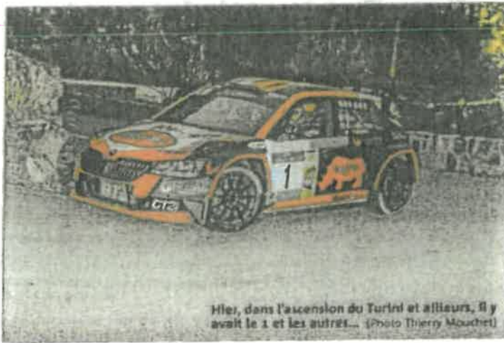
Hier, dans l'ascension du Turini et ailleurs, il y avait le 1 et les autres...

E t 1, et 2, et 3-0! Hier, sur les routes sillonnant les cols du haut pays, entre Saint-Jean (ES 1), sa majesté Turini (ES 2) et Braus (ES 3), le scénario de la première étape du Rallye national de Drap fut à sens unique. Tous derrière et lui devant !