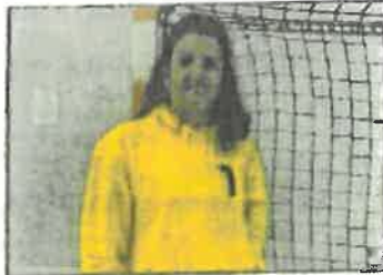
La coach niçoise reste déterminée à aller chercher le maintien.

Non c'est un match plein d'enseignement. Toutes les expériences sont bonnes à prendre et ça permet de faire progresser le