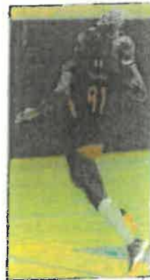
L'internationale camerounaise se veut aussi lucide.

À tous les niveaux, les Cagnoises ont pris l'ascendant, avec une bonne lecture du jeu, et des contres bien sentis. « Notre défense, c'est clairement notre point fort, on s'appuie donc des-