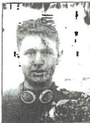
René Vietto, illustre coureur azuréen des années 1930-40.

La cyclo sportive la Drapoise - Souvenir René Vietto, quatrième manche du Challenge Granfondo des Alpes-Maritimes se dispute ce dimanche (départ et arrivée à Drap à l'espace Jean-Ferrat). La cyclo est ouverte à tous licenciés et non licenciés avec certificat médical obligatoire. Les organisateurs attendent entre 200 et 270 participants. Les inscrip-